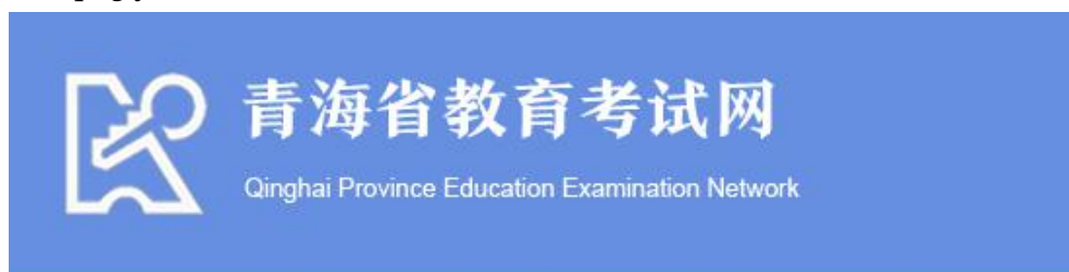
图 2.1 青海省教育考试网