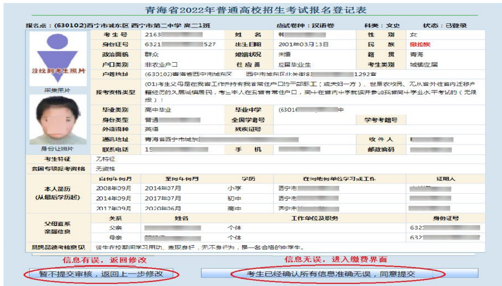
图 2.14 确认信息页面

再次核对信息后，如信息有误，考生点击“暂不提交审核，返回上一步修改”按钮返回修改信息；若信息无误，点击“考生已经确认所有信息准确无误，同意提交缴费”按钮提交本人信息并进入下一步缴费流程，提交至缴费页面后，考生将不能再修改个人信息。