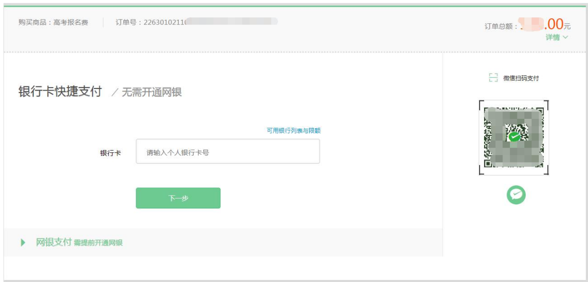
图 2.15 支付界面