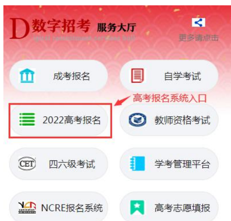
图 2.2 服务大厅截图