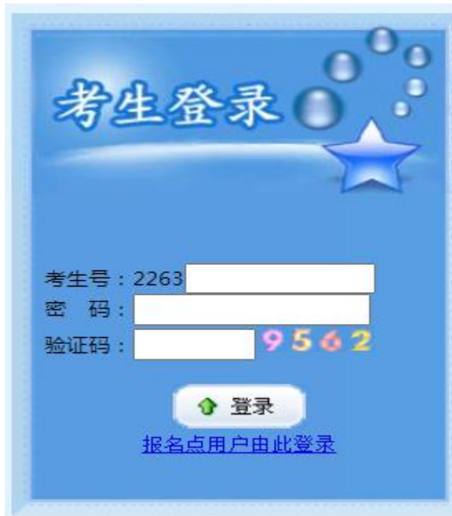
图 2.3 考生登录页