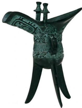
图 1 爵

1. “爵”通常被认为是饮酒器(图 1), 也是饮酒礼上尊卑关系的象征, 进而被用来代表品位序列。大约从西周到春秋, “五等爵”制渐趋成熟。这反映了