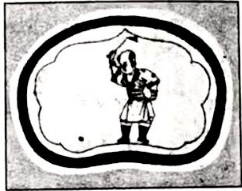
图乙宋代童子捶丸图