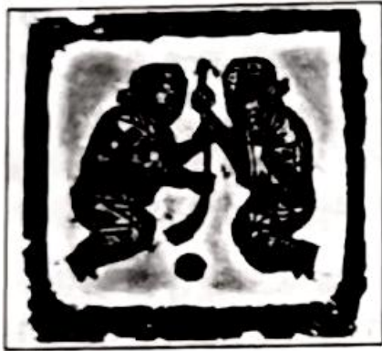
图甲宋代捶丸纹画像砖

4. 元代成书的《丸经》中有“宋徽宗、金章宗皆爱捶丸”的记载。宋代捶丸活动的图像资料也有发现（图甲、图乙）。元杂剧中有民间青年男女聚会游戏首选捶丸的情景，元曲中则有官员休闲时进行捶丸的描述。这表明，宋元时期捶丸活动