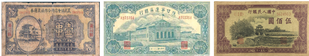
湖北黄冈县农民协会信用合作社发行的铜钱壹串文流通券 陕甘宁边区银行币 第一套人民币